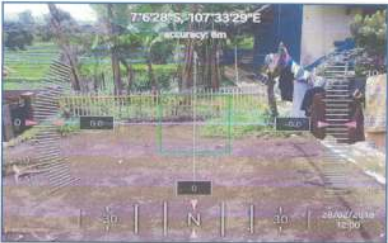
PHOTO PEMBANGUNAN POSYANDU RW 10.